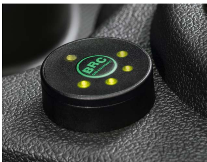
Переключатель газ/бензин расположен рядом с ручкой переключения передач и имеет четырёхуровневое отображение количества метана в баллоне