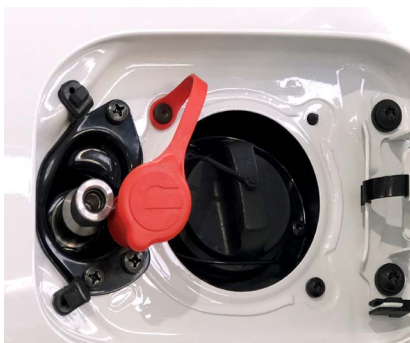
Заправочное устройство для заполнения газом расположено с правой стороны автомобиля в лючке рядом с горловиной бензобака